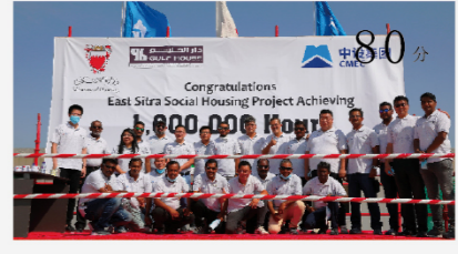
巴林东锡特拉保障房项目举办一百万安全工时活动 80分