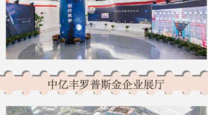
中亿丰罗普斯金企业展厅 80分