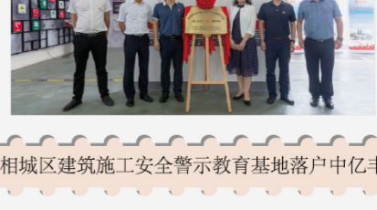
相城区建筑施工安全警示教育基地落户中亿丰 80分