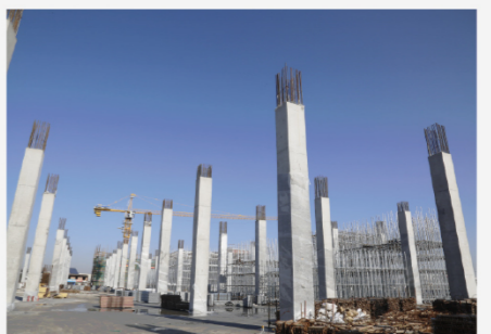
海尔(西安)虚实网服务项目B标段