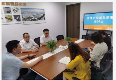
南京总部疫情防控商讨会