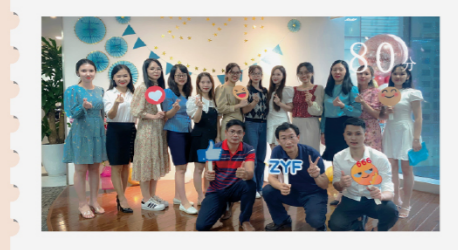
中亿丰越南成立五周年 80分