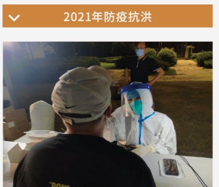
百水项目连夜核酸检测