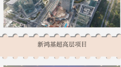
新鸿基超高层项目 80分