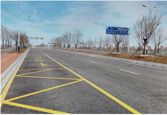
宿迁青海湖路西延二期工程 顺利通过完工验收

由中亿丰基础设施承建的青海湖路西延二期工程近日顺利通过竣工验收，本次验收工作由新建元城市发展（宿迁）有限公司市政工程管理部组织，苏宿园区工程质量监督站及各参建单位负责。当天，专家组在查看工程现场后，听取工程建设、设计、勘察、施工等各项工作报告，最终一致同意通过完工验收。