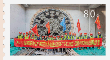
中亿丰首条地铁盾构区间实现双线贯通 80分