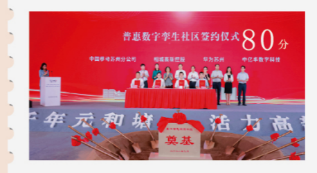
中亿丰数字与中国移动、华为、相城高新控股签约普惠数字孪生社区 80分