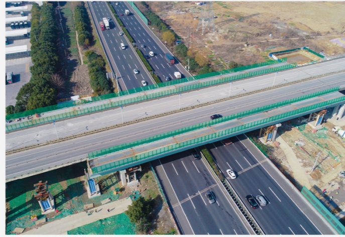
永方路（城北西路—阳澄湖西路）道路工程二标段 钢箱梁顶推落梁顺利完成

历时27个日夜，由中亿丰基础设施承建的永方路（城北西路—阳澄湖西路）工程主桥跨越沪宁高速钢箱梁顺利顶推完成。本次钢箱梁顶推采用整体钢箱梁顶推工艺，双幅钢箱梁总重1300多吨，顶推总行程共计379.2米。