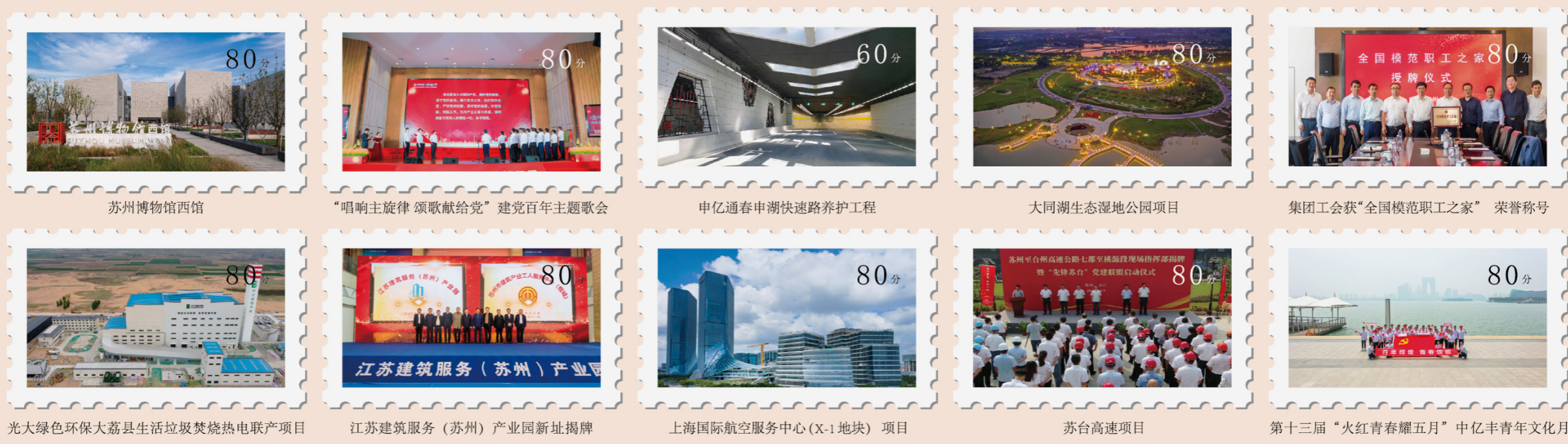
苏州博物馆西馆 80分 “唱响主旋律 颂歌献给党” 建党百年主题歌会 80分 申亿通春申湖快速路养护工程 60分 大湖生态湿地公园项目 80分 集团工会获“全国模范职工之家” 荣誉称号 80分 光大绿色环保大荔县生活垃圾焚烧热电联产项目 80分 江苏建筑服务(苏州)产业园新址揭牌 80分 上海国际航空服务中心(X-1地块)项目 80分 苏台高速项目 80分 第十三届“火红青春耀五月”中亿丰青年文化月 80分