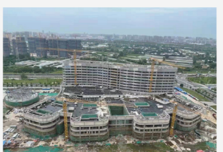
中储智运全国运行中心