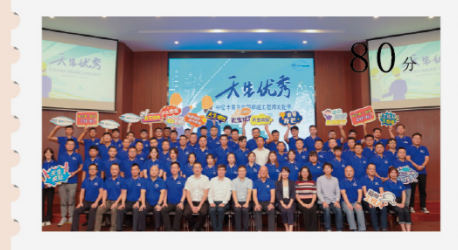
中亿丰南京总部首届卓越工程师文化节 80分