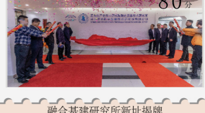
融合基建研究所新址揭牌 80分