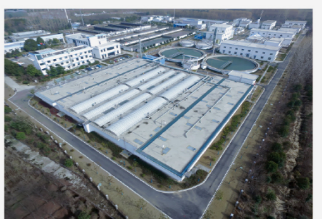
浦口区珠江污水处理厂中水厂二期建设工程