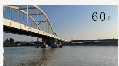
淮河流域重点平滩地治理工程泰东河工程 60分