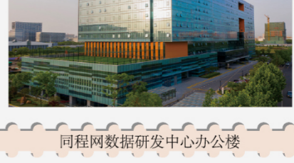
同程网数据研发中心办公楼 80分