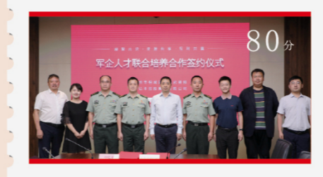
中亿丰控股与相城区人民武装部签订《军企人才联合培养中长期合作协议》 80分