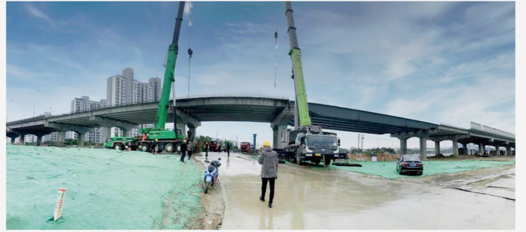
高新区马环连接线工程施工二标段 高架全线贯通

1月22日，在中亿丰马环连接线工程施工二标段施工现场，2台300吨大型起重吊机长臂舒展，将六片长41米、总宽22米、高1.85米、总重363吨的钢箱梁精准地架设在双支墩盖梁之上。至此，6片预制钢箱梁、155片预制混凝土箱梁和3片现浇混凝土箱梁全部完成，标志着马环线二标高架桥梁全线贯通。钢箱梁的圆满架设，完成了通浒路三层立体交通最上层高架桥梁工程的重难点突破，确保年前节点工程计划的顺利完成，为年后总体施工进度提供了保障。