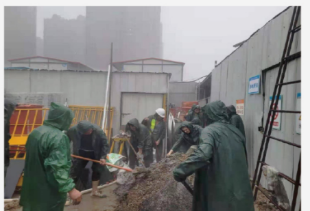
绿都紫荆商业二期项目抗洪