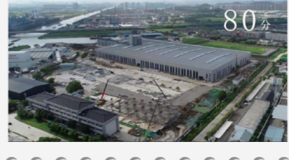
苏州城绿建科技股份有限公司新建PC构件项目 80分